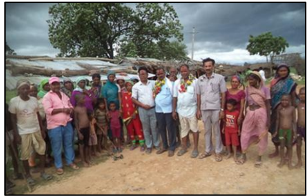
बाँकेको जानकी गाउँपालिकामा वडाध्यक्षसँग छलफल