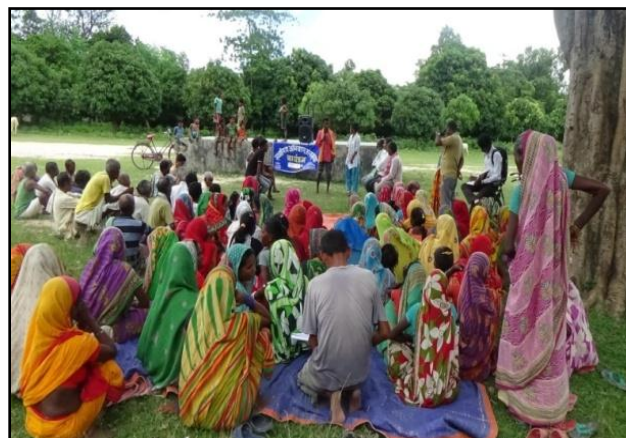
सुरक्षित बास र न्ययोचित ज्यालाबारे छलफल