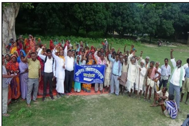
सुरक्षित बास र न्यायोचित ज्यालाको दररेटसम्बन्धि प्रतिवद्धता