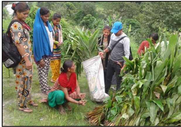
अलैचीको विरुवा वितरण तालामाराड, सिन्धुपाल्चोक

जिल्ला भूमि अधिकार मञ्च सँगको सहकार्यमा १६ सय अलैचीका विरुवा (गैरीथोक गाउँ भूमि अधिकार मञ्चको लागी ९ सय र पखेरा गाउँ भूमि अधिकार मञ्चको लागी ७ सय) वितरण गरिएको छ ।