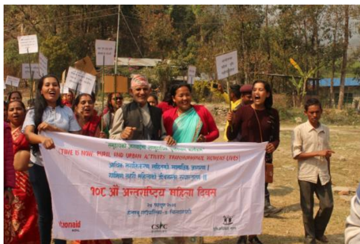
हेलम्बु गा.पा ४, महाकाल, सिन्धुपाल्चोकमा १०८ औं अन्तराष्ट्रिय महिला दिवसको कार्यक्रमका सहभागीहरू