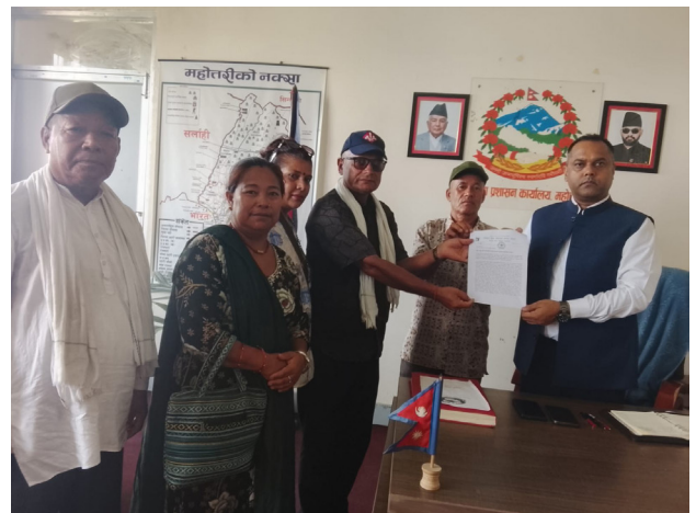
भूमिहीन दलित, भूमिहीन सुकुमबासी र अव्यवस्थित बसोबासीको समस्या समाधान एवं जग्गा व्यवस्थापनको कार्य यथासम्भव अघि बढाउन जिल्ला भूमि समस्या समाधान समितिका अध्यक्षहरूलाई ज्ञापन पत्र पेश, क्रमशः सिन्धुपाल्चोक, रसुवा, चितवन, रौतहट, सर्लाही र महोत्तरी ।