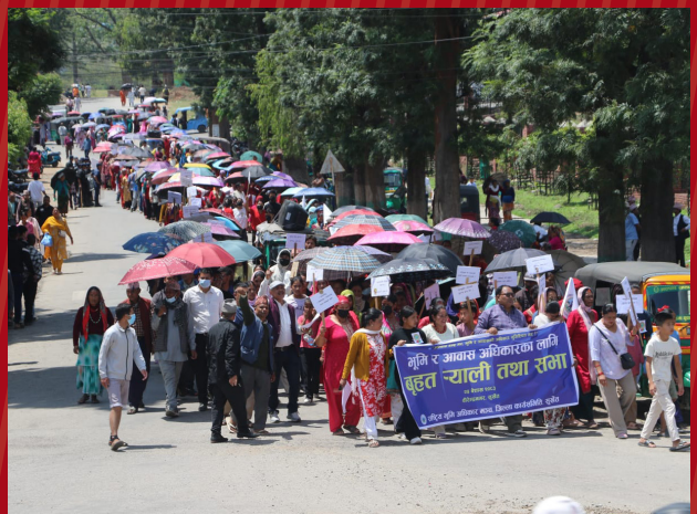
जवरजस्ती उठीबासका विरुद्ध भूमि अधिकार मञ्चको आन्दोलन, क्रमशः काठमाडौं, धनुषा, बाँके, महोत्तरी, सर्लाही र सुर्खेत ।